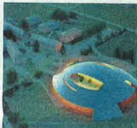
Le bâtiment, vu du ciel, tel qu'il se présentera de nuit.