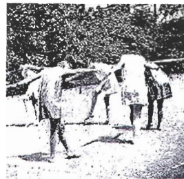
Ambiance d'époque à l'Institut Monte Rosa.