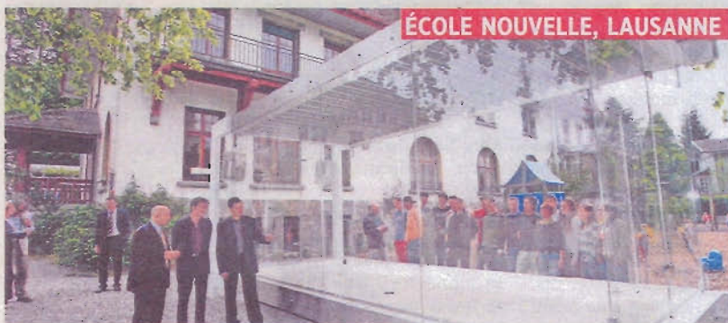
ÉCOLE NOUVELLE, LAUSANNE

CÉDRICK PHOTUS - AGC - PATRICK MARTIN - SYOMA - LEO - ERIC CAZANABARMA - ARC - PHILIPPE MÄGGER - DOMINIC FAIVRE - DENIS BAERBOUSE - PASCAL GUYOT - AFP - BEANI SOULÈCHE