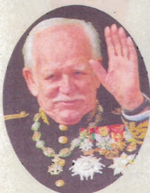
Rainier III de Monaco.