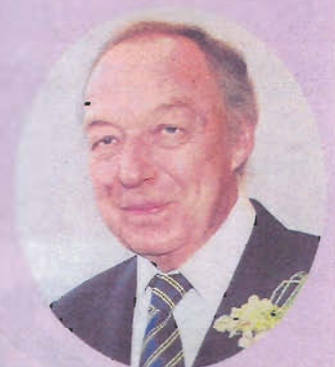
Jean-Pierre Hocké, ex-boss du HCR.