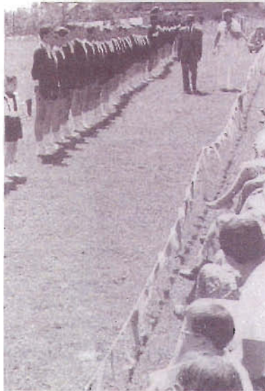
es de l'Aiglon Collège, à Chesières.

administratif et le rôle de relation avec l'Etat de l'AVDEP n'ont pas disparu, son apport est surtout culturel. «Certaines écoles privées étrangères ont voulu importer en Suisse leur propre modèle,