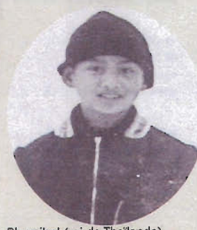
Bhumibol (roi de Thaïlande) à l'époque où il vivait en Suisse.