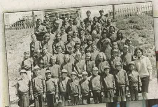
Les élèves de l'année scolaire 1962-1963.