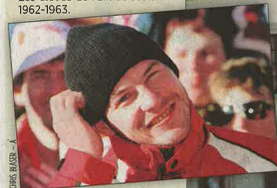
Jacques Villeneuve, pilote de F1 et habitué de la station: l'un des plus célèbres anciens élèves.