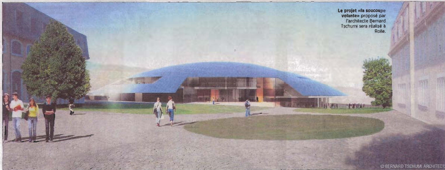
Le projet «la soucoupe volante» proposé par l'architecte Bernard Tschumi sera réalisé à Rolle.