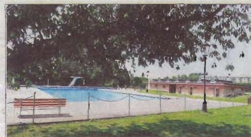
La piscine extérieure et les vestiaires du Rosey.