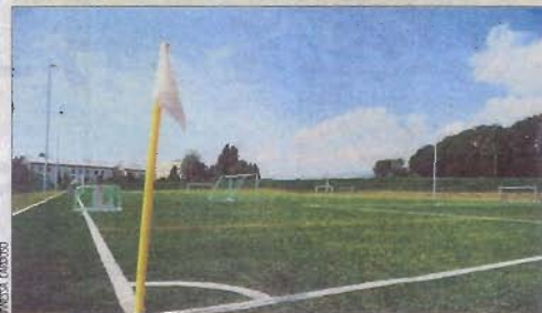
L'un des trois terrains de football du complexe sportif.

de familles célèbres ou couronnées, mais certainement de milieux qui ont de gros moyens puisque la pension et l'écolage varient entre 70 000 et 90 000 francs par année suivant l'âge de l'élève. L'internat emploie 170 personnes, dont 90 professeurs, au service de 380 élèves de 53 nationalités différentes. Afin de garantir cette représentation internationale, un quota maximal de 10% par pays a été adopté.