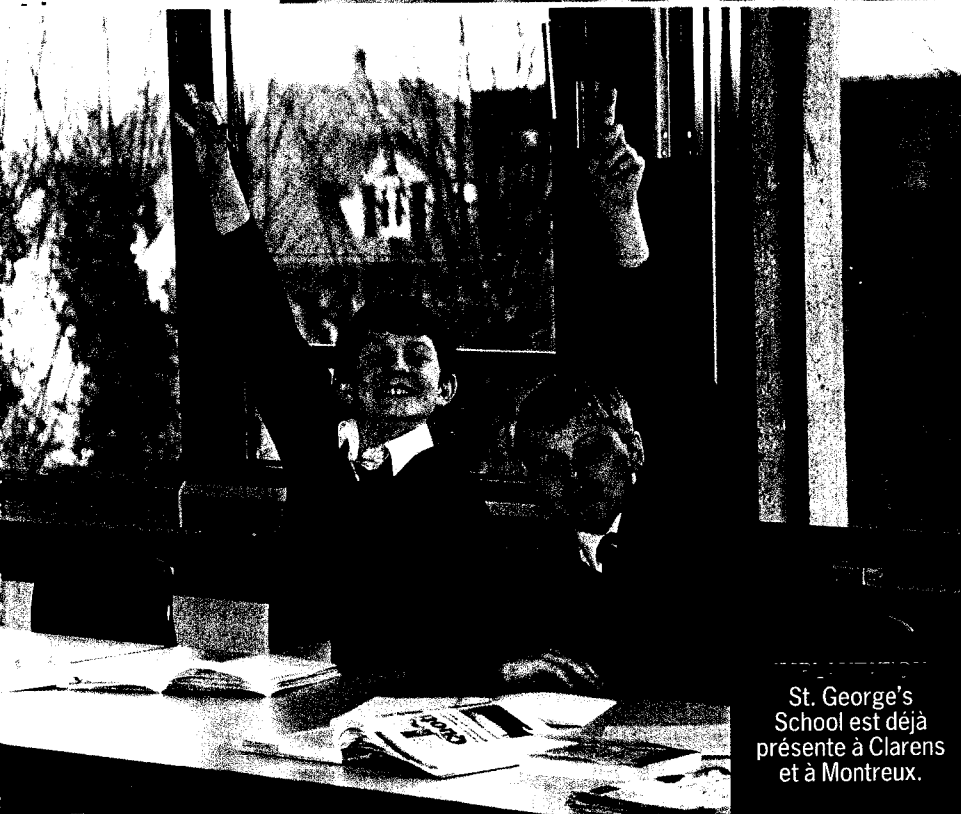
St. George's School est déjà présente à Clarens et à Montreux.